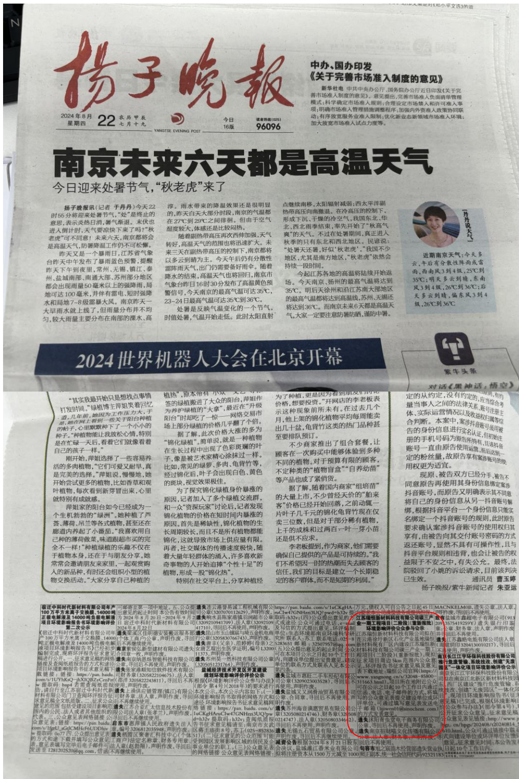
图 3.2-4 报纸公告照片（扬子晚报 2024 年 8 月 23 日）