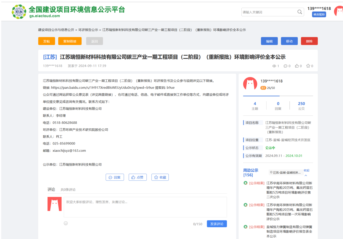
6.2-1 全本公示网页截图