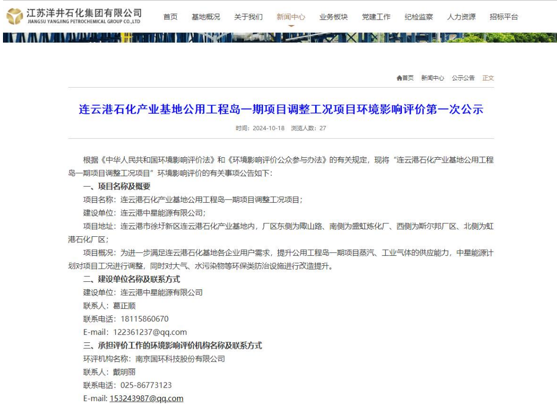
图 2.2-1 第一次网络公示截图

首次环境影响评价信息采用网络公示，公示网站为江苏洋井石化集团有限公司网站，网站对外公开，因此，本项目首次环境影响评价信息公示选取的网络平台符合相关要求。公示起始时间为 2024 年 10 月 18 日。第一次公示网页截图见图 2.2-1。