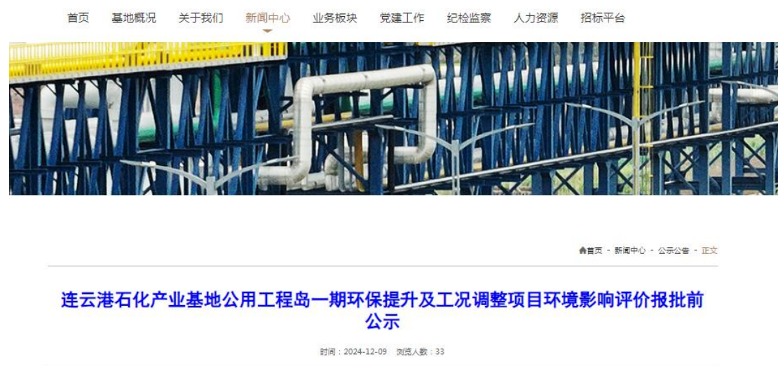
图 6.2-1 报批前公示截图

本项目环境影响报告书报批前公开采用网络公示，公示网站为江苏洋井石化集团有限公司网站（ https://www.lygshjd.com/news-show.html?id=2175223 ），网站对外公开。公示时限为2024年12月9日至2024年12月13日，公示有效期为5个工作日。网页截图见图3.2-1。