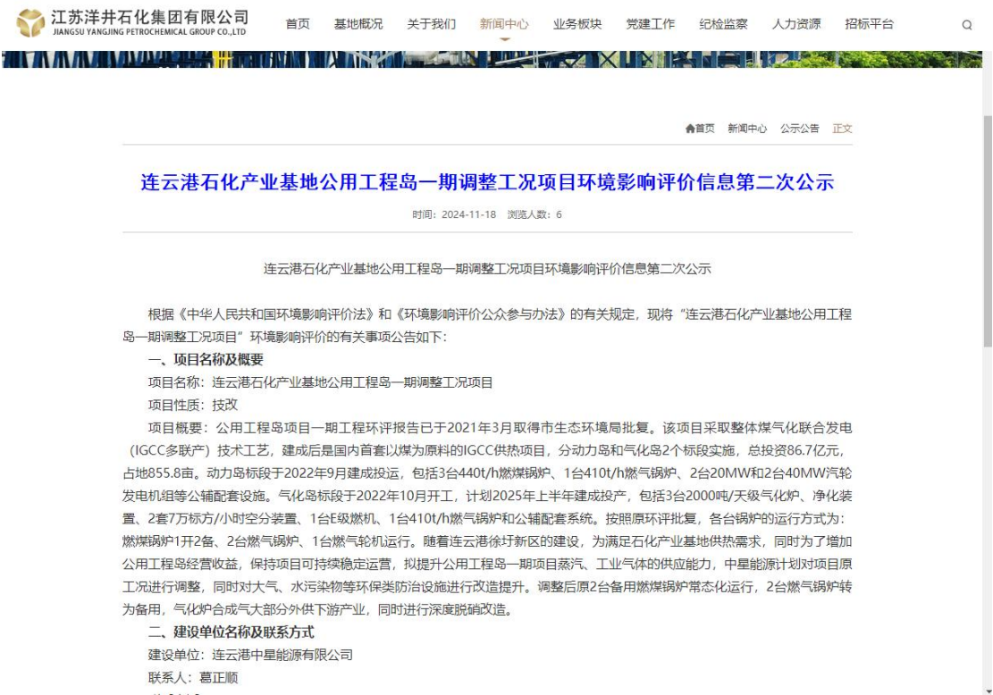
图 3.2-1 第二次网络公示截图

本项目环境影响报告书征求意见稿首先采用网络公示，公示网站为江苏洋井石化集团有限公司网站上，网站对外公开。公示时限为 2024 年 11 月 18 日至 2020 年 12 月 2 日，公示有效期为 10 个工作日。网页截图见图 3.2-1。