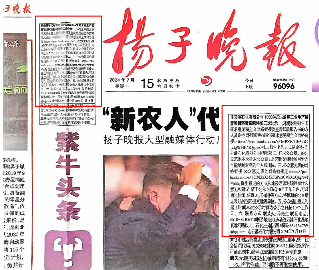
图 3-2 2024 年 7 月 15 日《扬子晚报》报纸公示信息