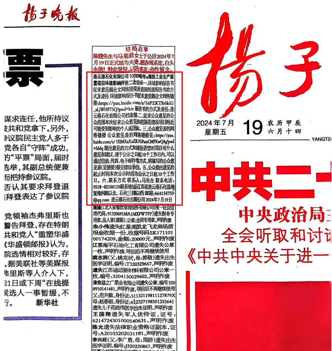
图 3-3 2024 年 7 月 19 日《扬子晚报》报纸公示信息

本次公示选取的扬子晚报属于省级的公开发行的主流报刊，符合《环境影响评价公众参与办法》（生态环境部令第 4 号）要求：“通过建设项目所在地公众易于接触的报纸公开，且在征求意见的 10 个工作日内公开信息不得少于 2 次。”